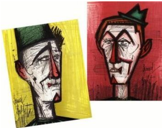
Clown jaune, 1967 Clown rouge, 1967 lithographies, 31 x 24 cm Collection privée