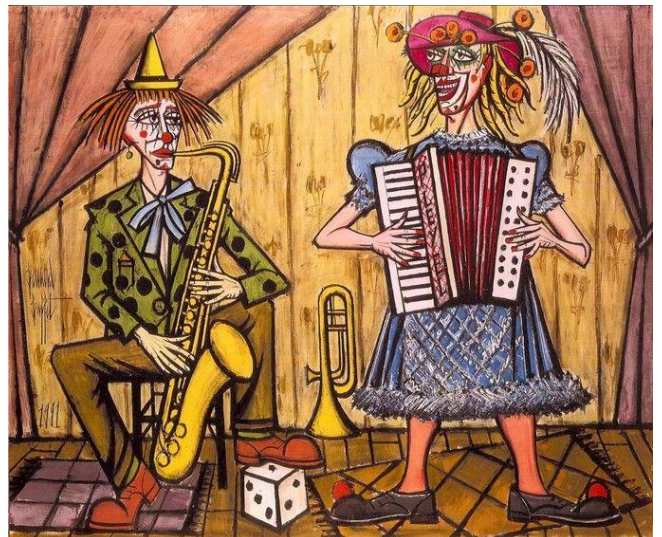
Les clowns musiciens, le saxophoniste, 1991 huile sur toile, 117,2 x 77,5 cm National Gallery, Londres (Grande-Bretagne)

Bernard Buffet a peint des clowns tout au long de sa carrière, il réalisa une cinquantaine d'œuvres sur ce thème. Derrière ces figures poétiques et colorées se cache souvent l'autoportrait mélancolique du peintre.