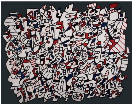
Ontogénèse, 1975 (1 024 x 809 cm)