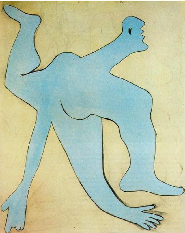
L'acrobate, 1929 huile sur toile, 162 x 130 cm Musée Picasso, Paris (France)