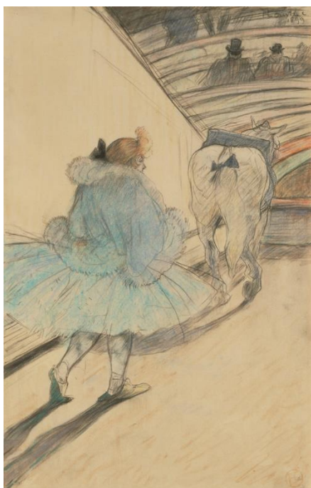
Au cirque : Entrée en piste, 1899 Crayon et craie, 31 x 20 cm The Getty Collection (Etats-Unis)