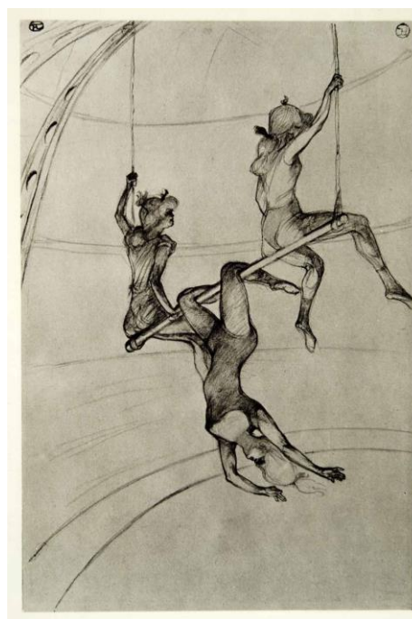
Au cirque : Le trapèze volant, 1899 Crayon, 45,5 x 34 cm Collection Robert Lehman