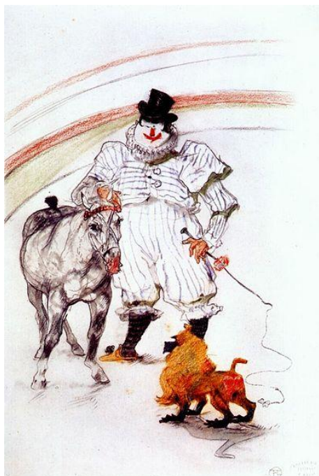
Au cirque : Cheval et singe dressés, 1899 Crayon et craie, 32,5 x 25 cm Art Institute of Chicago (Etats-Unis)

Cette toile fait partie d'une série de 39 dessins autour du cirque. La comtesse de Toulouse-Lautrec fait interner son fils, dans une clinique de Neuilly, pour le sauver de son addiction à l'alcool. C'est pour prouver aux médecins qu'il avait retrouvé ses facultés mentales qu'il réalisa au crayon noir et crayons de couleurs cette série de 39 dessins. C'est un travail fait sans modèle et dessiné de mémoire, basé sur ses seuls souvenirs. Les médecins, stupéfaits par la cohérence de ces œuvres et la dynamique des mouvements le laissent sortir le 17 mai 1899. De ses œuvres sont nées de véritables scènes de vie.