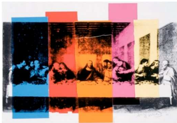
La cène, sérigraphie, 600 x 472 cm, 1987

sérigraphiés, comme ceux de Mao Zedong. Warhol est alors inondé de commandes.