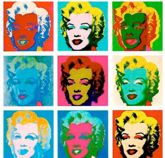
Marylin, sérigraphie, 1967

En 1972, il fait un retour à la peinture avec des portraits