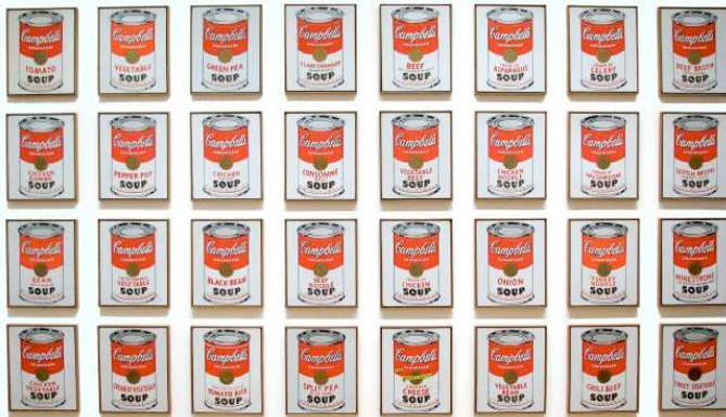
200 Campbell's Soup Cans, acrylique sur toile, 183 x 254 cm, 1962

Entre 1945 et 1949, il fait ses études d'art au Carnegie Institute of Technology. En 1949, il commence à travailler comme dessinateur publicitaire.